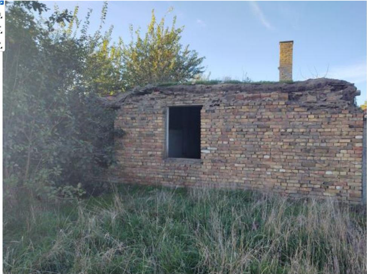
Parcela 2560-srušeni objekti